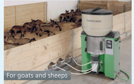
For goats and sheep