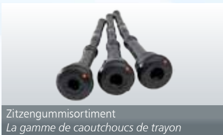
Sitzgummisortiment La gamme de caoutchoucs de trayon