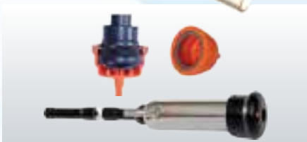
ClearWash Spülaufnahme; Schauglas L' unité de lavage ClearWash; voyant