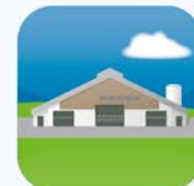
Anlagenplanung Facility Design Planification d'installations