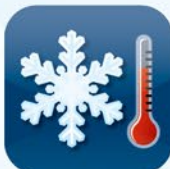
Kühltechnik Cooling System Refroidissement