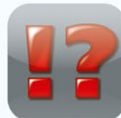
Verschiedenes Diverse Divers