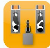
Automatisches Melken Automatic Milking Traite automatique