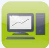
Automatisierung Automation Automatisation