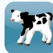
Jungvieh Young Stock Jeunes bovins