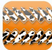
Melkstände Milking Parlours Salles de traite

Alles aus einer Hand · Full line supplier · Grâce à une seule source