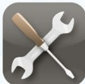
Service und Zubehör 24/7 Service and accessories 24/7 Service et équipement 24/7