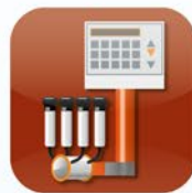
Melktechnik Milking Equipment Technique de traite