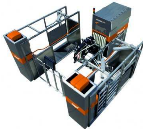
System Happel AktivPuls® Robot 2020, Automatisches Melksystem: Einzelbox / Doppelbox Konfiguration

Die neue Vormelkeinheit ist serienmäßig in jedem AktivPuls® Robot 2020 Melkroboter. Kunden, die bereits mit dem erfolgreichen AktivPuls® Robot 2020 von System Happel arbeiten, können ihr System durch ein Setup ganz einfach anpassen. Weitere Informationen: www.system-happel.de