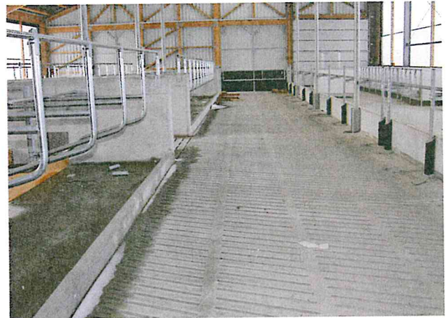
Die Stork GbR setzt auf Spalten. Trockene Laufflächen sind den Verantwortlichen wichtig.

brett ein schlüssiges und zum Betrieb passendes Stallkonzept.