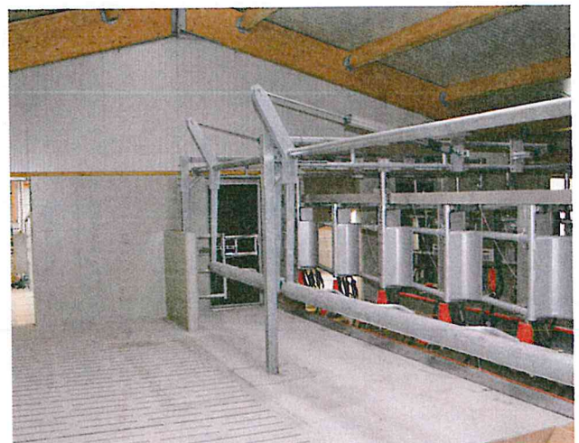
Der Schnellaustrieb sorgt für einen zügigen Gruppenwechsel.