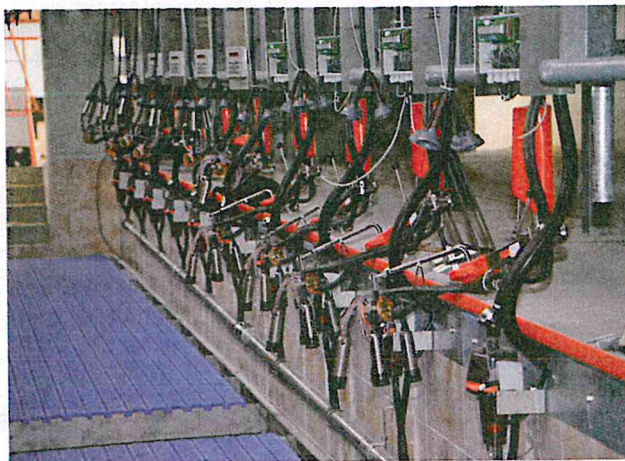
Der 2x14 Fischgrätenmelkstand wird vorerst nur mit 2x10 Melkeinheiten bestückt.

ben und kann auch per Funk-Fernbedienung betätigt werden. Um den Melkvorgang zeitlich zu minimieren, wollte Stork auf einen Frontaustrieb nicht verzichten. Die Frontbegrenzung schwenkt nach dem Melken pneumatisch nach oben und gibt die ganze Reihe frei. Laut Happel reduziert der Schnellaustrieb die Umtriebszeiten im Melkstand um bis zu 40 %. Je nach Melkstandgröße lässt sich dadurch eine Zeitersparnis von 5 bis 12 % der Gesamtmelkzeit realisieren. Auch der großzügige Austriebbereich ist unterkellert und mit Spalten ausgelegt. Stork ist gespannt, ob das AktivPuls-System von Happel ihm hinsichtlich der Eutergesundheit Vorteile bringen wird. Happel wirbt mit einem natürlichen Melkvorgang welcher die Zitzen, den Strichkanal und den Schließmuskel