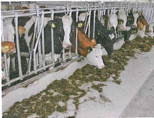
Ein Epoxidharzbelag schützt den Futtertisch.