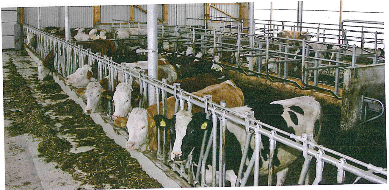
Schon eingezogen sind die hochtragenden Färsen. Die nächste Kuhgeneration steht in den Startlöchern.