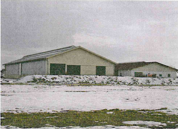
Liegehalle (l.) und Melkgebäude sind so platziert, dass eine Spiegelung jederzeit möglich ist. Melkhaus und Liegehalle sind lediglich durch einen Treibgang miteinander verbunden.