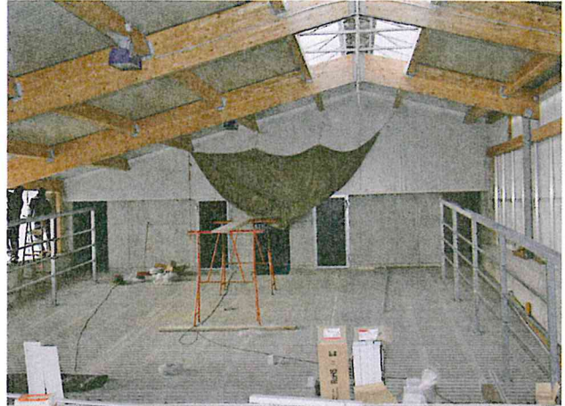
Der Vorwarteraum vor dem Melkstand bietet Platz für eine Leistungsgruppe. Der gesamte Wartebereich ist unterkellert und mit Spalten ausgelegt.

men, dass wir den Schritt wagen. »Die gute Flächenausstattung des Betriebs hat Stork die Entscheidung erleichtert. Futter das bisher an umliegende Biogasanlagen verkauft werden konnte, kann zukünftig wieder im eigenen Betrieb verwertet werden. Nach den Einschränkungen im Ort war