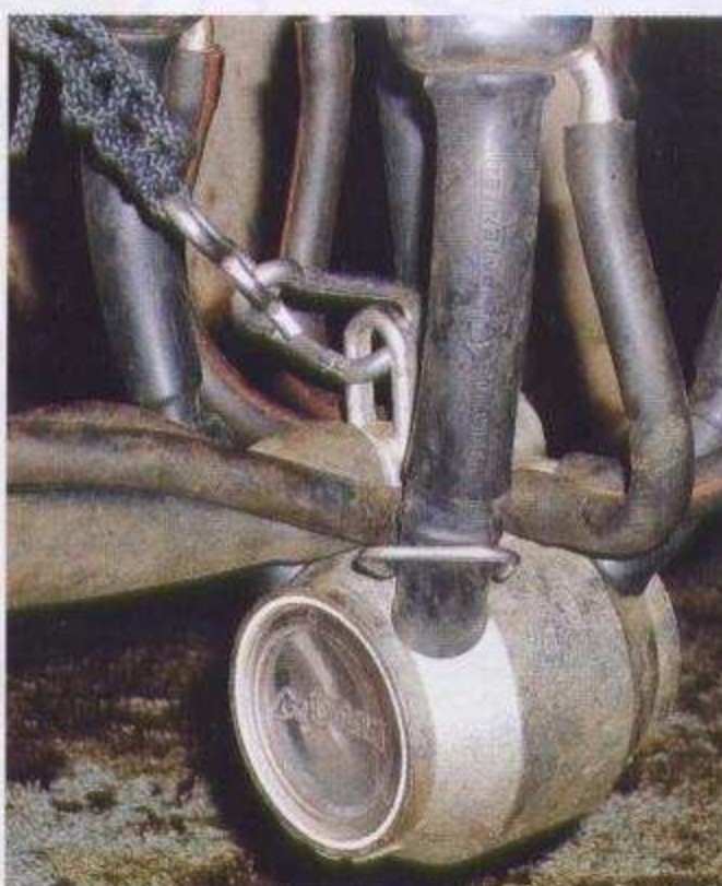
Das zentrale Steigrohr beim MC 73, DeLaval, dämpft das Vakuum.

Gute Ergonomie ist unverzichtbar. So sollte ein Melkzeug zum einen ergonomisch gestaltet sein. Wichtig ist dabei unter anderem, dass es handlich ist und somit zügig angesetzt werden kann. Vorteile haben hier naturgemäß Melkzeuge mit kleinen Sammelstücken, wie die der Hersteller Boventis (Bovi 60), Dairymaster, Impulsa und besonders das Spezialmelkzeug Biomilker (Siliconform). Daneben erfüllen auch einige Melkzeuge